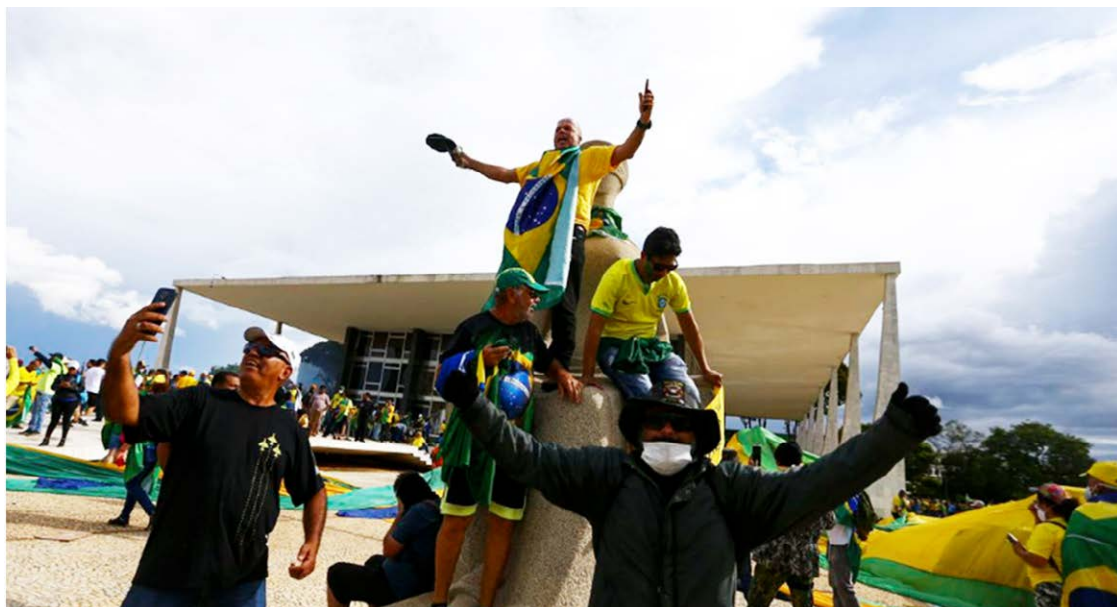
Polícia Federal investiga financiadores dos atos de vandalismo de 8 de janeiro