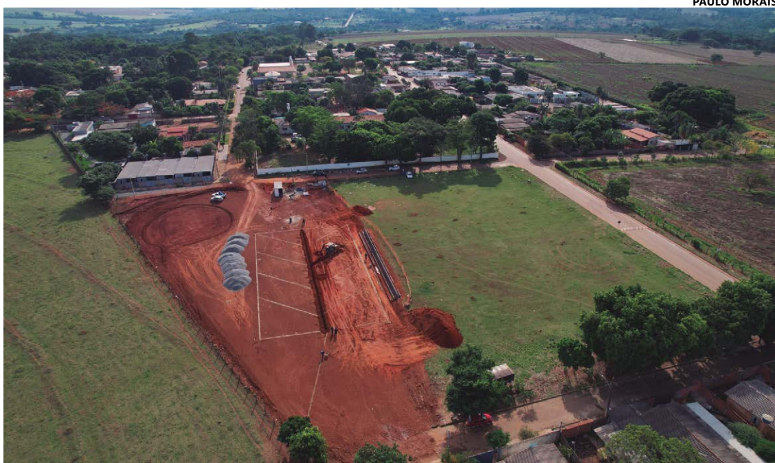
Área definida para o espaço esportivo terá campo society, playground, academia da 3ª Idade e área de lazer

A possibilidade de construção da nova praça esportiva em Joanópolis, segundo informou o prefeito, representa uma conquista para a gestão e os moradores. Naves contou que havia uma dificuldade de levar melhorias àquela comunidade, pela falta de áreas públicas. E, ressaltou, agora a Prefeitura resolveu o problema, “hoje vencemos mais uma batalha”.