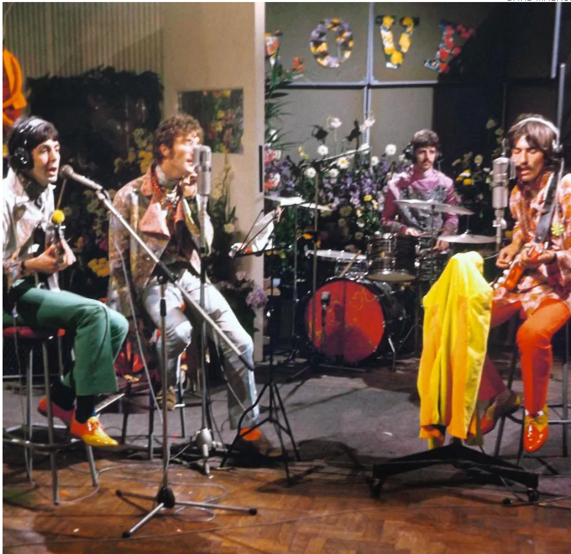
A postos: Paul, John, Ringo e George ensaiam no estúdio Abbey Road, em Londres, no ano de 1967