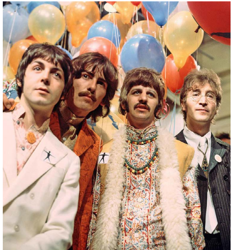
‘Sgt Pepper's Lonely Hearts Club Band’: banda é clicada em 67, ano em que disco saiu