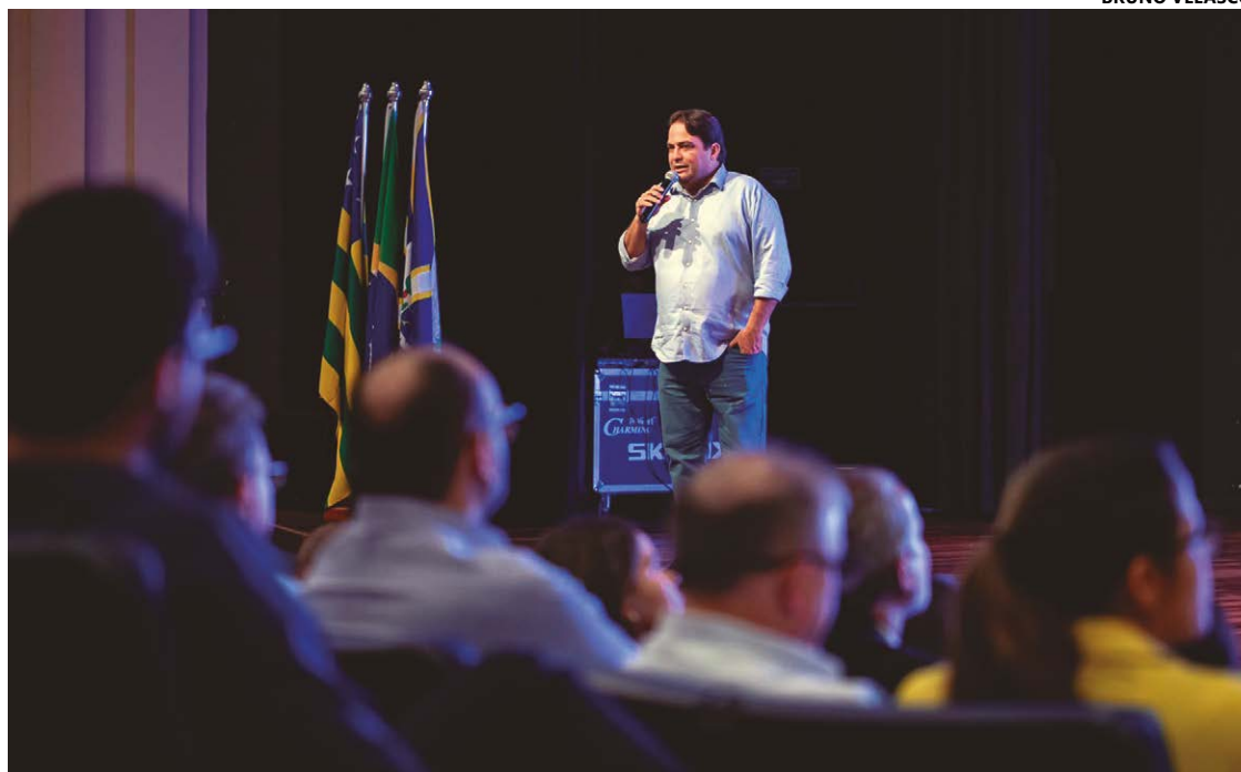
Roberto Naves informa medidas administrativas na máquina pública para enfrentar redução de repasses federais

“O trabalho remoto já funcionou no período de pandemia. O Ministério Público funciona muito bem assim. E vamos fazer isso, regulamentado, com regras, atento à produtividade, com metas a serem cumpridas por esses servidores”, disse Roberto Naves.