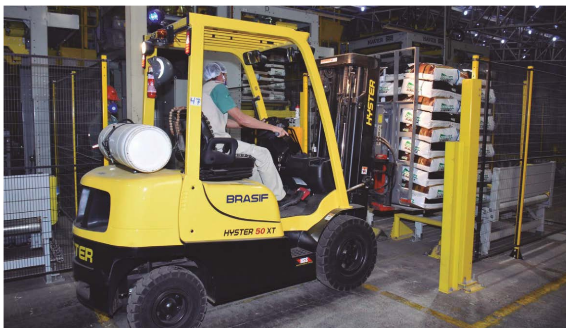
Índice indica aumento no total de investimentos, número de empresas e na geração de empregos no Estado

Os índices divulgados pelo BC confirmam pesquisas internas do Instituto Mauro Borges de Estatísticas e Estudos Socioeconômicos (IMB) e coloca o estado na segunda posição nacional. Na variação acumulada no ano, Goiás também obteve o 2º lugar, apresentando aumento de