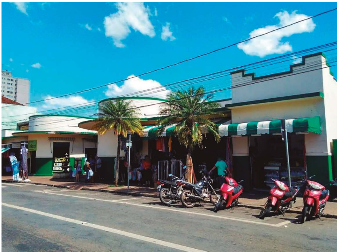
Entre os espaços em debate estão o Mercado Municipal, Estádio Jonas Duarte, Ceasa e outros em várias áreas

Tem coisas que não tem justificativa da prefeitura estar tocando. E não somos nós que estamos criando isso. Você pega o governo passado, que teve a coragem de passar o Terminal Urbano para a Urban. Gerou desgaste, gerou transtorno, mas toda a mudança irá gerar. E hoje funciona bem. A pergunta é: a prefeitura tem realmente que seguir administrando o Ceasa? Ela tem que continuar custeando o Ceasa, um local que temos empresários que exploram e ganham dinheiro através desse comércio – e é justo tem que ganhar mesmo. Mas quem tem que bancar o custo do Ceasa? A