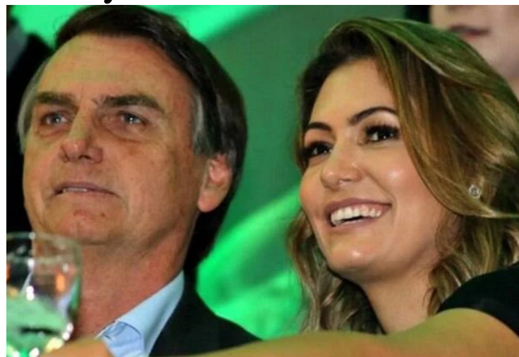
Jair e Michelle Bolsonaro: reforço à pré-campanha do PL em Goiás