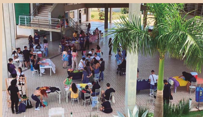
No campus, população adquire alimentos produzidos pelos alunos

“As atividades sempre são chamadas abertas. Tivemos, por exemplo, uma oficina de produção de hambúrgueres artesanais, palestras sobre inteligência artificial, a Feira de Troca e Economia Solidária, um projeto onde os alunos são convidados a produzir algo para entender um pouco como se dá esse processo