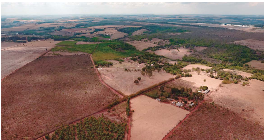
Politec contará com uma área de 921.032 metros quadrados, 13 quadras e investimentos de R$ 35 milhões