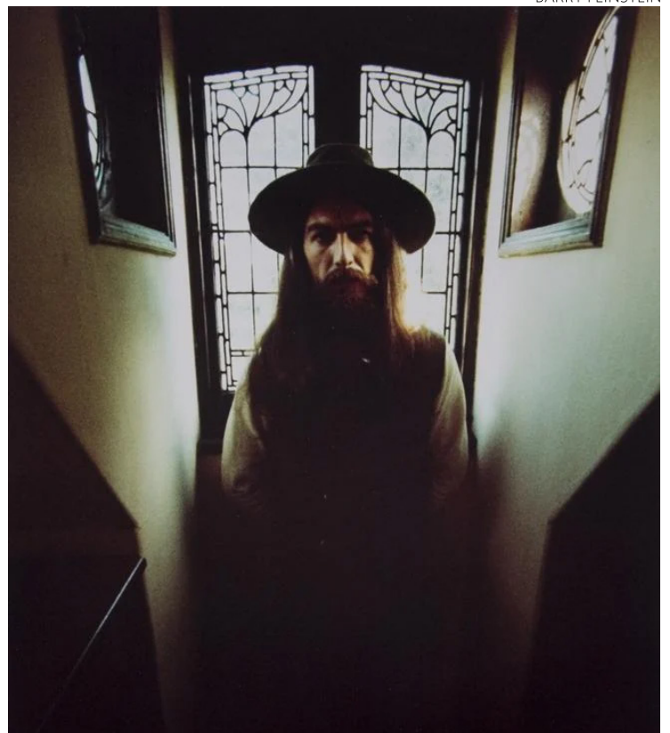
‘Beatle quieto’: invasor desferiu 40 golpes no músico