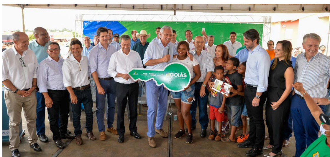
Ronaldo Caiado ressaltou, durante solenidade de entrega das moradias, parcerias firmadas com as prefeituras, que cedem os terrenos

Caiado fez questão de ressaltar que o trabalho na iniciativa ocorre em parceria com as prefeituras, que cedem o terreno para as construções. “É uma realização ímpar. O que estamos fazendo em tantos municípios é levar alegria, dignidade para