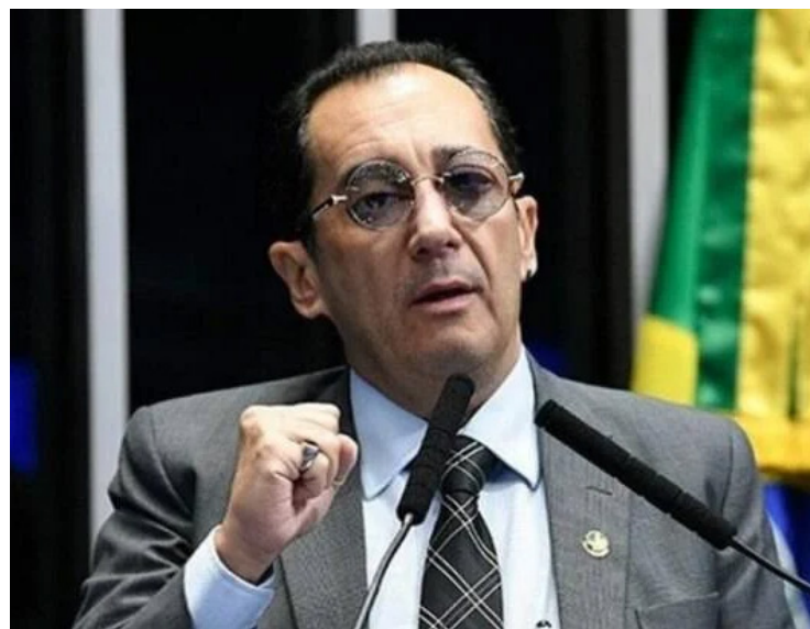
Gustavo Gayer: envolvido em nova polêmica