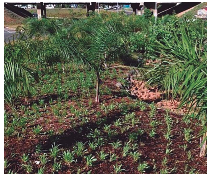
Ações em pontos críticos e plano dividido em 3 níveis de risco