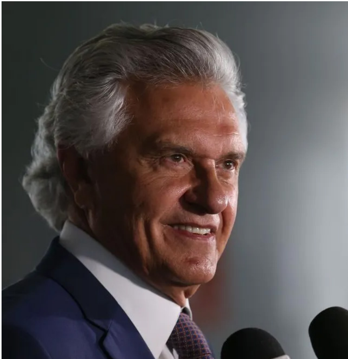
Ronaldo Caiado: carreira política vitoriosa, aprovado como gestor, novas ideias para o país

Caiado tem também uma relação honesta e de alteridade