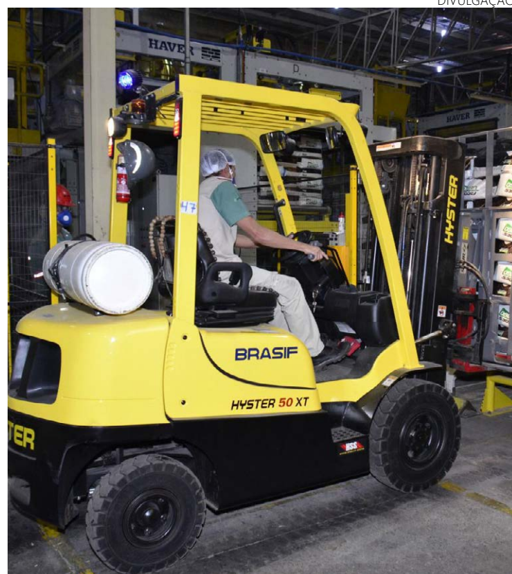
Agropecuária, indústria e setor de serviços se destacam na pesquisa que revela crescimento econômico de Goiás

O Brasil apresentou crescimento econômico de 3,06% no acumulado do ano. Na variação interanual, o aumento foi de 1,28%; seguido pelo crescimento de 2,82% na variação acumulada nos últimos 12 meses.